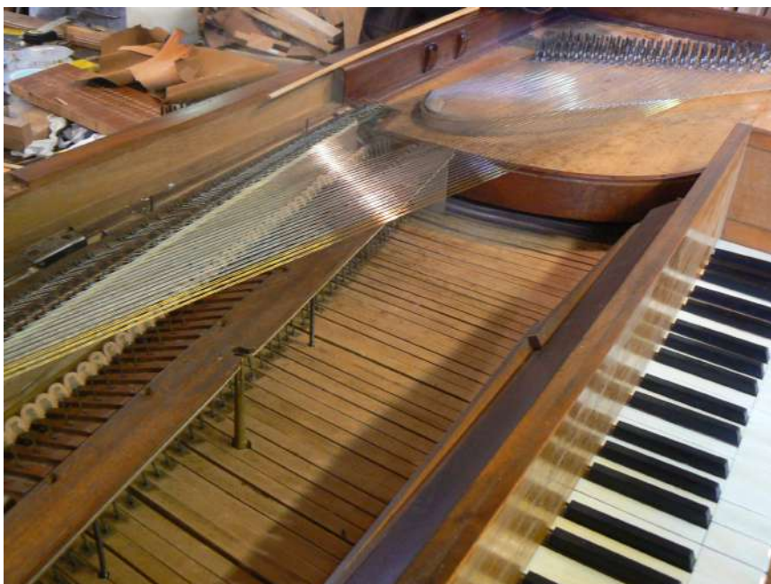
Piano Carré Erard 1806, Cordes en laiton et fer et Marteaux en peaux restaurés