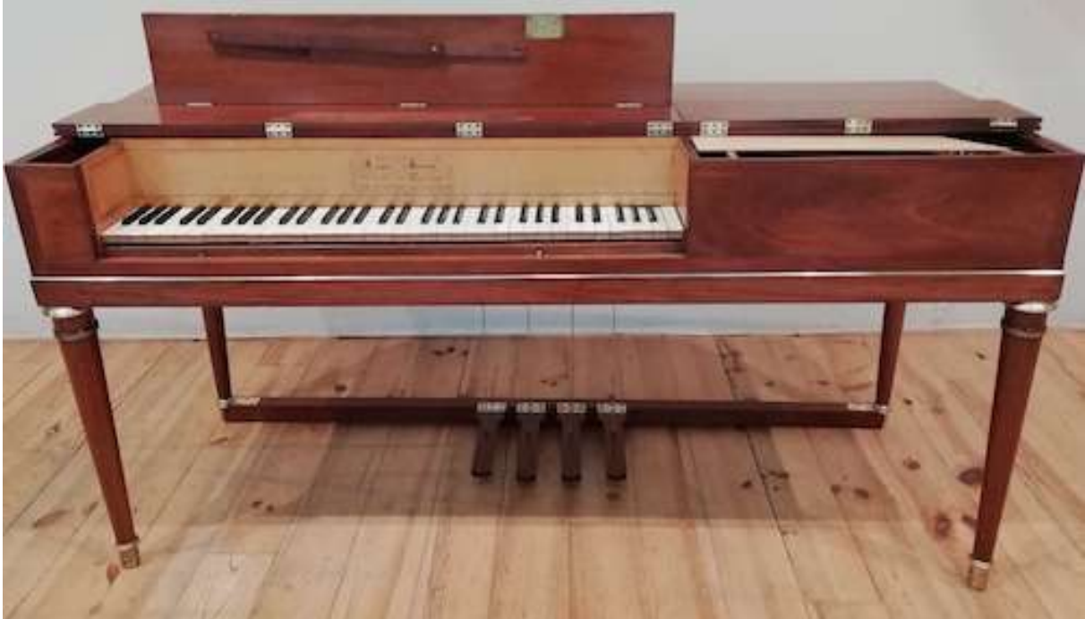
LE PIANO CARRE ERARD 1806, n° 6486

Les 7,8,9 février 2020 – Salle Cortot et Reid Hall