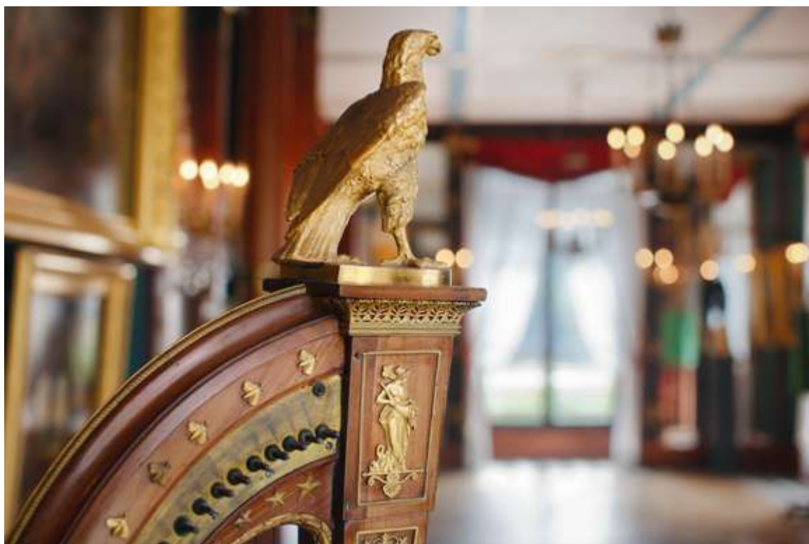
Détail de la harpe Cousineau de l'impératrice Joséphine