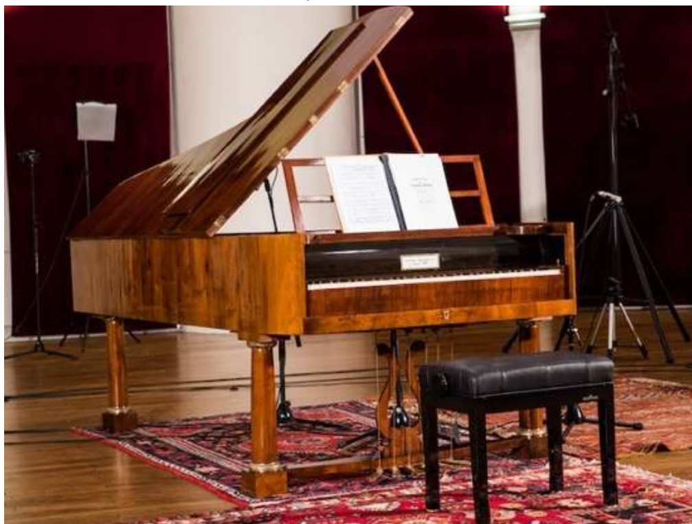
Piano à queue Rosenberger 1825, collection Luca Montebugnoli