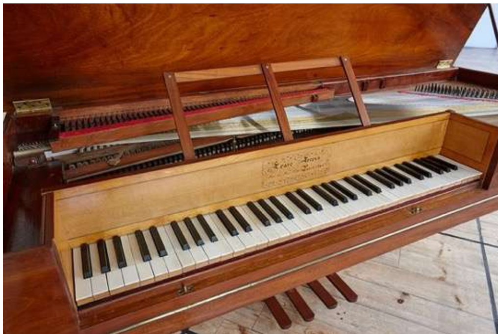
Piano carré Erard 1806, collection La Nouvelle Athènes